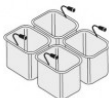
SET 4 CESTELLI GN1/6 TIKPCM704018