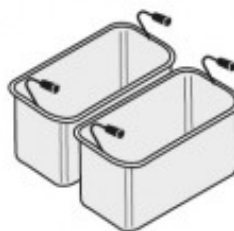
SET 2 CESTELLI GN1/3 TIKPCM704016