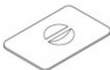
COPERCHIO GN2/3 TIKPCM704006