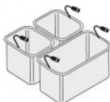
SET CESTELLI 1XGN1/ 3+2XGN1/6 TIKPCM704019