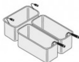
SET CESTELLI 1XGN1/ 3+2XGN2/6 TIKPCM904016