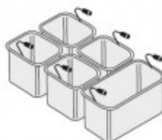
SET CESTELLI 1XGN1/ 3+4XGN1/6 TIKPCM904017