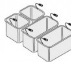
SET CESTELLI 2XGN1/ 3+2XGN1/6 TIKPCM904019