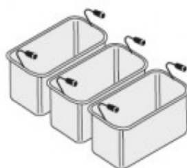
SET 3 CESTELLI GN1/3 TIKPCM904013