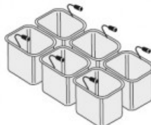
SET 6 CESTELLI GN1/6 TIKPCM904014