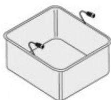
CESTELLO GN 1/1 TIKPCM904002