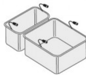
SET CESTELLI 1XGN1/ 3+1XGN2/3 TIKPCM904015