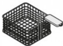
CESTELLO EXTRA PER VASCA 17 LT TIKPCM704003