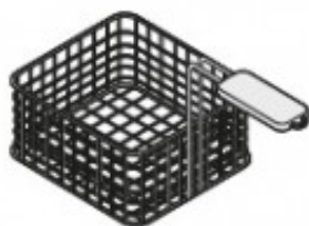
CESTELLO EXTRA PER VASCA 17 LT TIKPCM904001