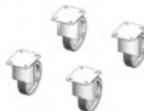
MAGG. NE KIT RUOTE Ø125 GE40200530