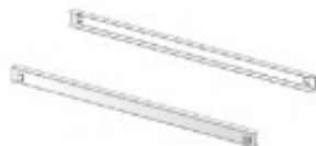
COPPIA GUIDE GN 1/1 THG TG7 GE40200506