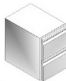
CR7/2BT CASSETTIERA BT NO. 2 CASSETTI 1/2 GE40202600