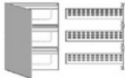
3 CASSETTI INTERNI ALLA PORTA AL POSTO DELLA GRIGLIA IBKCTI.73