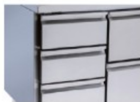
CASSETTIERA 3 CASSETTI IN LUOGO DELLA PORTA IBKHCTR.73