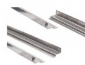
COPPIA GUIDE INOX PER GN 1/1 IBKHCG.11