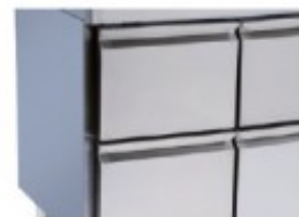
CASSETTIERA 2 CASSETTI IN LUOGO DELLA PORTA IBKHCTR.72