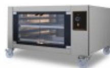
CELLA DI LIEVITAZIONE DC7020150002