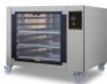
CELLA DI LIEVITAZIONE DC7020150001