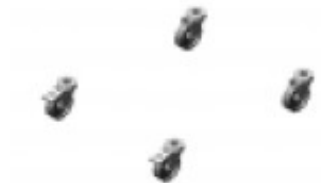
SET 4 RUOTE INOX CDO444000020