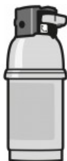
SISTEMA FILTRAGGIO ACQUA MDAWF1100