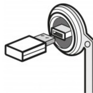
PORTA USB SALVATAGGIO DATI HACCP MDAUS00X