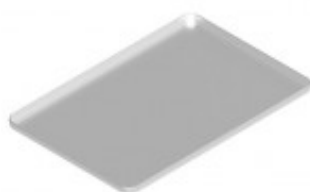
TEGLIA ALLUMINIO MM 600 X 400 X 20 TKKT9P/A