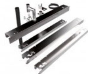
KIT SOVRAPPOSIZIONE FORNI 4 TEGLIE ELETTRICI TKEKKM4