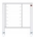
TAVOLO FORNI ELETTRICI CON SUPPORTI E RUOTE PER EKF 311 - EKF 364 - EKF 411 - EKF 464 IN TUTTE LE VERSIONI TKEKTRS411