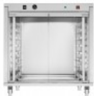
LIEVITATORE CON RUOTE TKEKL864R