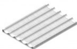
TEGLIA ALLUMINIO FORATA 5 CANALI MM 600 X 400 X 20 TKKTF9P