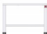
TAVOLO PER SOVRAPPOSIZIONE 2 FORNI PER EKF 311 - EKF 364 - EKF 411 - EKF 464 IN TUTTE LE VERSIONI TKEKT411D