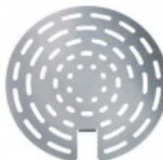
RIDUTTORE DI PORTATA ARIA TKEKRP/A