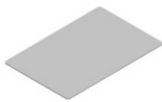
PIASTRA IN ALLUMINIO ALIMENTARE NON RIVESTITO 600X400 MM TKKPP64