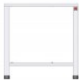
TAVOLO FORNI ELETTRICI EKF 311 - EKF 364 - EKF 411 - EKF 464 IN TUTTE LE VERSIONI TKEKT411