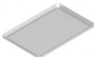
TEGLIA ALLUMINIO FORATA MM 600 X 400 X 20 TKKTF8P/A