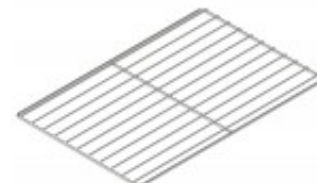
GRIGLIA CROMATA MM 600 X 400 TKKG9P