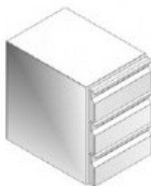
KPFRTA4007 CR7/3 CASSETTIERA REFR. NO. 3 CASSETTI 1/3 GE40202305.K1