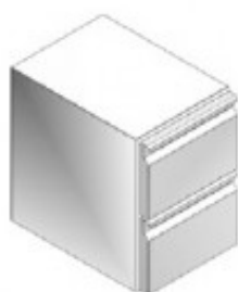
KPFRTA4006 CR7/2 CASSETTIERA REFR. NO. 2 CASSETTI 1/2 GE40202300.K1