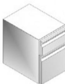
KPFRTA4008 CR7/4 CASSETTIERA REFR. NO. 2 CASSETTI 1/3 + 2/3 GE40202310.K1