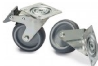
RC 400 / RC 600 - SET N.4 RUOTE CZKITCS1AE6A00