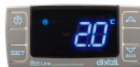
XR02CX-5R1C1 DIXELL TERMOSTATO CZE20A111C3D00