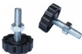
RC/RN 600-CR/CRX 4 - SET N.2 PIEDI + N.2 ROLLER CZKITFT1AE6A00