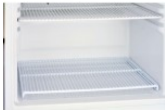
CR/CRX 6 - GRIGLIA INFERIORE CZI01AR69A0002