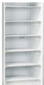
CN/CNX 6 - EVAPORATORE A GRIGLIA CZI01AS07A0001