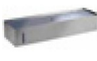
SERBATOIO ACQUA TKEKSA