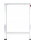
TAVOLO FORNI ELETTRICI PER EKF 423 - EKF 443 - EKF 523 IN TUTTE LE VERSIONI TKEKT423