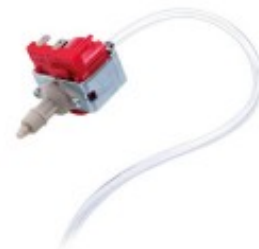
KIT POMPA CON TUBO E FILTRO TKKKPU