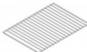
GRIGLIA CROMATA PIANA MM 480 X 340 TKKG8