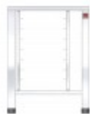
TAVOLO FORNI ELETTRICI CON SUPPORTI PER EKF 423 - EKF 443 - EKF 523 IN TUTTE LE VERSIONI TKEKTS423