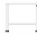
TAVOLO PER SOVRAPPOSIZIONE 2 FORNI PER EKF 423 - EKF 443 - EKF 523 IN TUTTE LE VERSIONI TKEKT423D