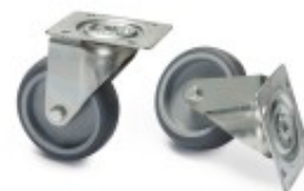
RC 640/TAVOLI - SET N. 4 RUOTE CZKITCS1A14A00