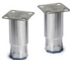
RC 640/RC 1390/D 7 - SET N.4 PIEDI CZKITFT1A14A01