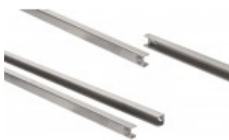
QR/QN SER. SET GUIDE PER SUPPORTO GRIGLIA CZKITGD2AP7A00