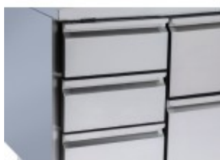
SET DI CASSETTI 1/3 (PROFONDITÀ 700MM) CZDWA4RWAA02500