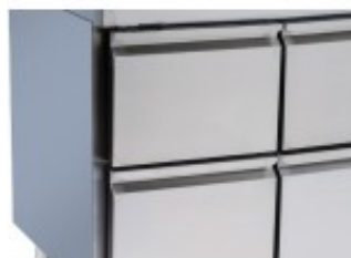
SET DI CASSETTI 1/2 (PROFONDITÀ 700MM) CZDWA5RWAA02500