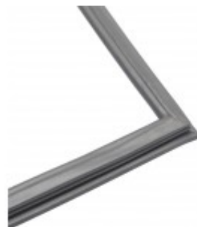
QR/SR SER. - GUARNIZIONE PORTA CZR02AP72A0003