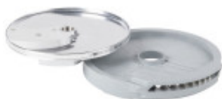
DISCO PER TAGLIO LISTELLI DIRITTI CON SPESSORE DI MILLIMETRI 8 X 16 SOLO PER CL50D/52D/55D CL50D- E/ 52D - E /55D/ CL 50 GOURMET/ CL 60 - R502D -