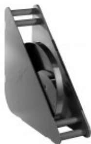
CONTENITORE DISCHI IN POLICARBONATO ADATTO A DISCHI PER R502 E R602/ CL50 E CL60 MX60.27258