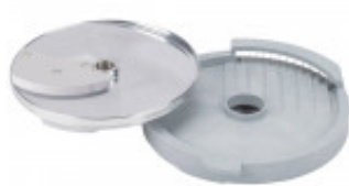
DISCO PER TAGLIO LISTELLI DIRITTI CON SPESSORE DI MILLIMETRI 8 X 8 SOLO PER CL50D/52D/55D CL50D- E/ 52D - E /55D/ CL 50 GOURMET/ CL 60 - R502D -