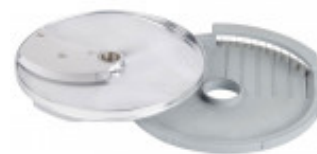
DISCO PER TAGLIO LISTELLI DIRITTI CON SPESSORE DI MILLIMETRI 10 X 16 SOLO PER CL 50-52-55D TL-60 MX60.28158