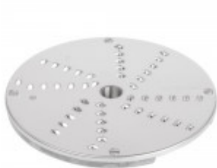
DISCO PER TAGLIO JULIENNE CON SPESSORE DI MILLIMETRI 4 PER CL50D/ 52D/55D CL50D- E/52D - E /55D/ CL 50 GOURMET/ CL 60 - R502D - E- R602 - R652