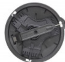
D-CLEAN KIT PER PULIZIA GRIGLIE PER TAGLIO CUBETTI MX60.39881