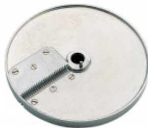
DISCO PER BRUNOISE 2X2MM PER CL50 GOURMET MX60.28174