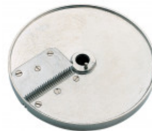
DISCO PER BRUNOISE 4X4MM PER CL50 GOURMET MX60.28176