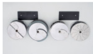
PORTA DISCHI A PARETE 4 ASTE INOX MX60.107812