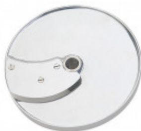
KIT PER TAGLIO PREZZEMOLO PER CL 50 GOURMET MX60.28194