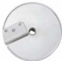
DISCO PER TAGLIO GOFFRATO DA 2MM PER CL50 GOURMET MX60.28198