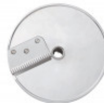
DISCO PER TAGLIO GOFFRATO DA 6MM PER CL50 GOURMET MX60.28178