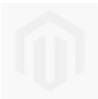
ACCESSORIO SCHIACCIAPATATE COMPLETO DA 6 MM MX60.28209