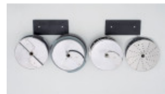
PORTA DISCHI A PARETE 4 ASTE INOX MX60.107812