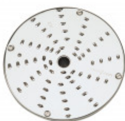
DISCO PER TAGLIO JULIENNE CON SPESSORE DI MILLIMETRI 1.5 PER CL50D/52D/55D CL50D- E/ 52D - E /55D/ CL 50 GOURMET/ CL 60 - R502D -